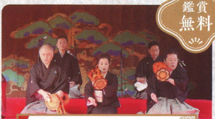
離子校友会新春演奏会 「夢がいっぱい鼓の音」