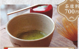
お庭茶会「はつはるの会」