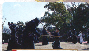
少年剣士による 初稽古披露