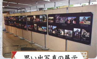
思い出写真の展示

●時間/1回目 11:30~・2回目 12:30~ ●備前岡山獅子舞太鼓唄保存会