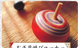
お正月遊びコーナー