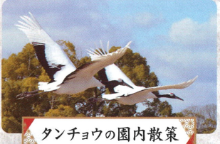
タンチョウの園内散策