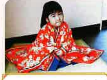
子どもおひなさま体験