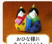
おひな様に 色を付けよう♪