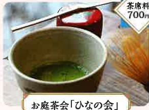
お庭茶会「ひなの会」