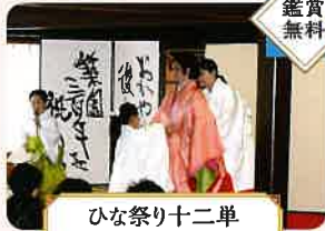
ひな祭り十二単 お服上げ(着付け体験)