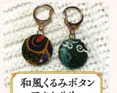
和風くるみボタン アクセサリ