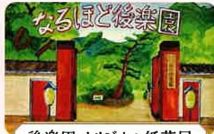
後樂園 オリジナル紙芝居