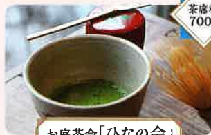
お庭茶会「ひなの会」

明治17年に後樂園が池田家から岡山県に譲渡され、一般公開の記念式典が行われた3月2日を「開園記念日」に定め、様々なおもてなし行事を催しています。