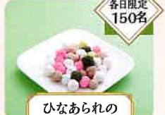
ひなあられの ふるまい