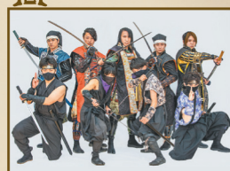
安芸ひろしま武将隊