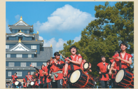
岡山学芸館高校 和太鼓部

謎解きクリエイター集団「RIDDLER」 代表取締役。RIDDLER制作の岡山城 謎解き事業が9月末から開始。