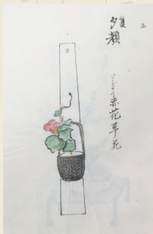
専敬流活花源氏之図(左から「花散里」「桐壺」「夕顔」) 大正7年 個人蔵