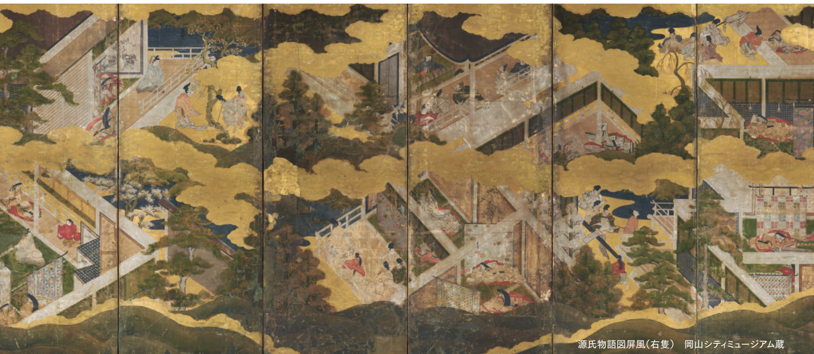
源氏物語図屏風(右隻) 岡山シティミュージアム蔵