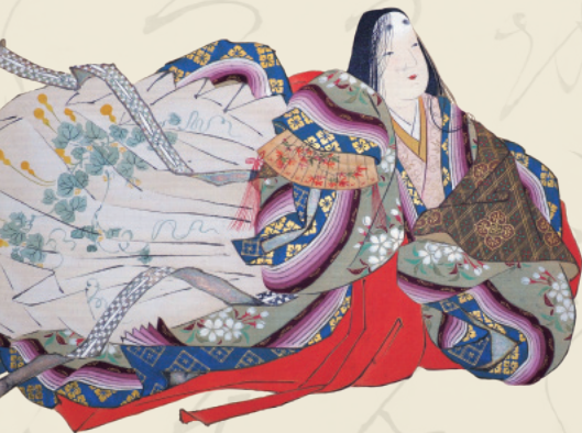
土佐光起 筆 百人一首手鑑(紫式部・部分) 林原美術館蔵 (前期:4/1~5/8展示)