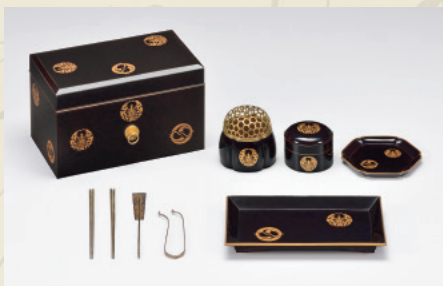
輪蝶祇園守紋蒔絵婚礼調度 香道具 林原美術館蔵 (後期:5/9~6/16展示)