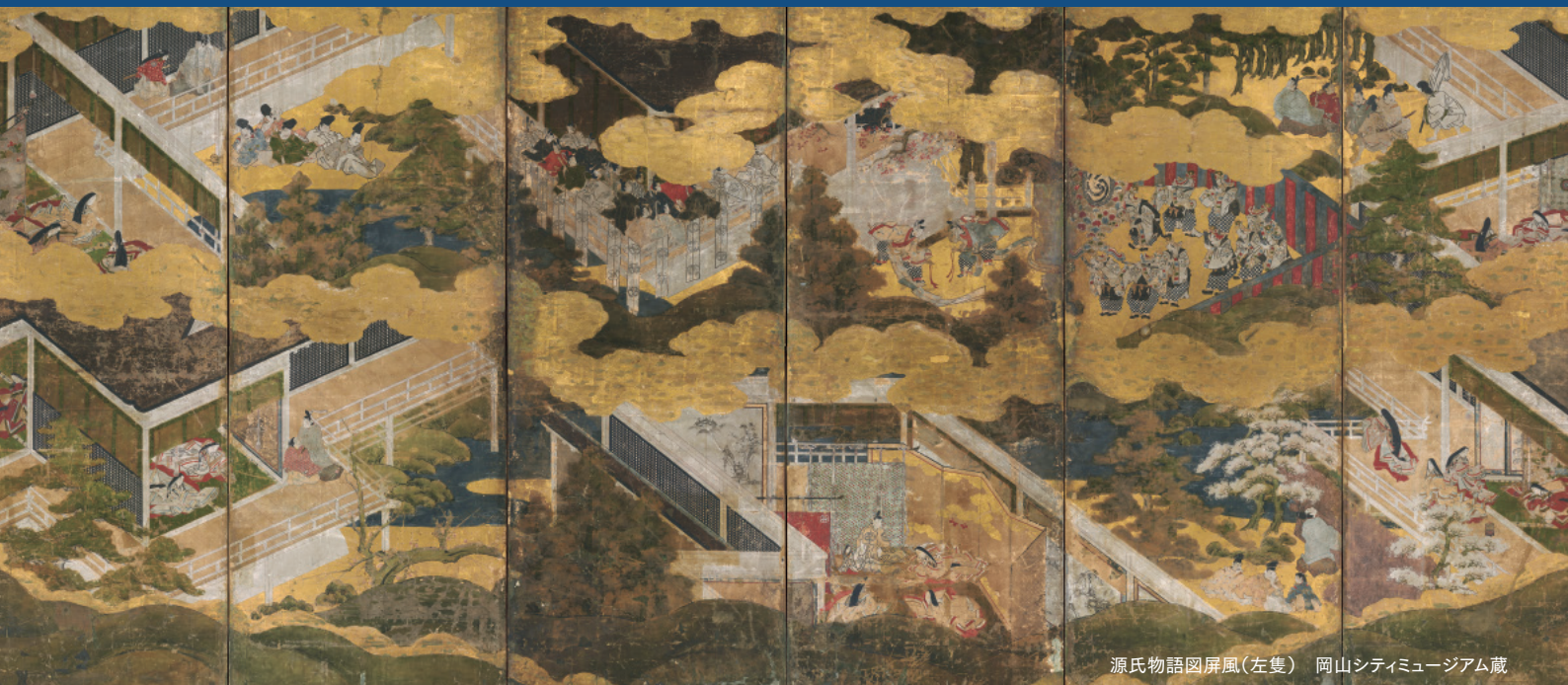
源氏物語図屏風(左隻) 岡山シティミュージアム蔵