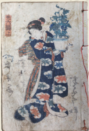
柳亭種彦 著『修紫田舎源氏』廿六編(左から下巻、上巻) 江戸時代 個人蔵