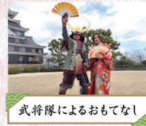
武将隊によるおもてなし