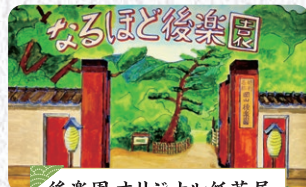
後楽園 オリジナル紙芝居