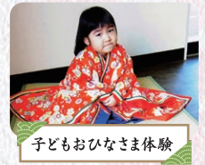
子どもおひなさま体験