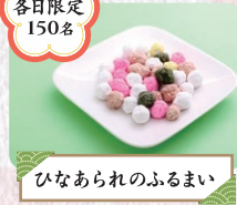
ひなあられのふるまい