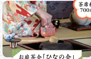
お庭茶会「ひなの会」