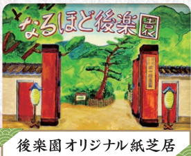
後楽園オリジナル紙芝居