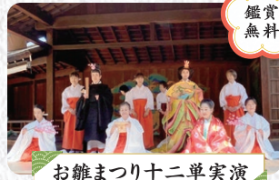
お雛まつり十二単実演